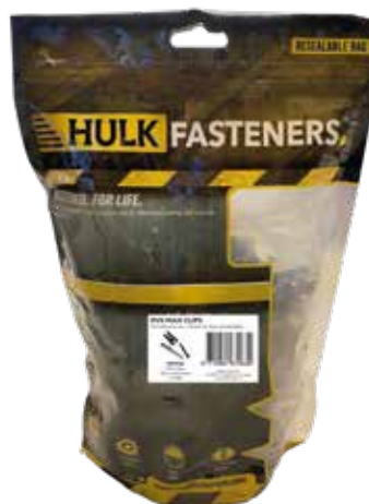
Hulk RVS clips en RVS schroeven

EVA-LAST® I-series kunnen normaal onderhouden worden met een borstel of een hogedrukreiniger (maximaal 80 bar). Indien u de hogedrukreiniger gebruikt om uw terrasdelen schoon te maken, moet u deze op min. 30cm afstand houden tot de terrasdelen. Bij intensief een veelvuldig reinigen kan er een kleurverschil ontstaan omdat de originele kleur weer boven komt. Dit zal na verloop van tijd weer vervagen. Lichte krassen kunt u verwijderen met een staalborstel in lengterichting. Let wel op dat u geen reinigingsmiddel gebruikt dat kunststof aantast. Bijtende producten bijvoorbeeld vogelpoep etc. direct verwijderen. Geen warme voorwerpen zoals barbecues, vuurkorven, fakkels, buitenhaarden etc. onbeschermd op uw terras plaatsen. Zware voorwerpen die van grote hoogte vallen kunnen uw terras beschadigen.