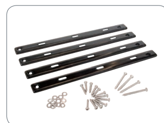
#006633 BLINDE BEVESTIGINGSPROFIELEN