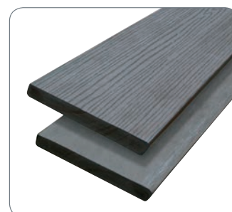
#007910 2,5 X 19 CM MASSIEF ANTRACIET